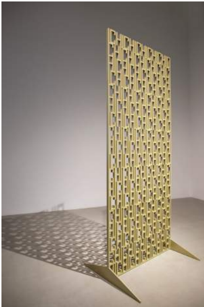
Marbod Fritsch, ICHICHICH, 2022, lackiertes, wasserstrahl-geschnittenes Aluminium, 180 x 77 x 4 cm