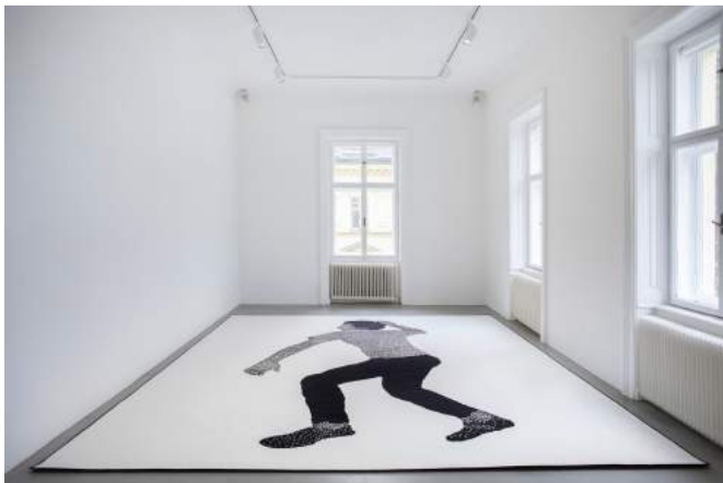
Marbod Fritsch, Sleeping or falling 2022, digitaler Chromojetdruck auf Polyamidvelour, 500 x 400 cm