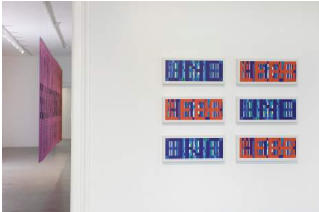
Marbod Fritsch, Ohne Titel, 2023, Digitaldruck auf Gessoboard, 20 x 50 cm