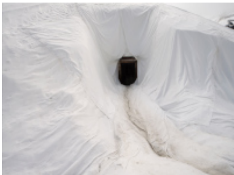
Michael Goldgruber, Entrance, 2020, Fineart-Pigment-Print, Ausschnitt