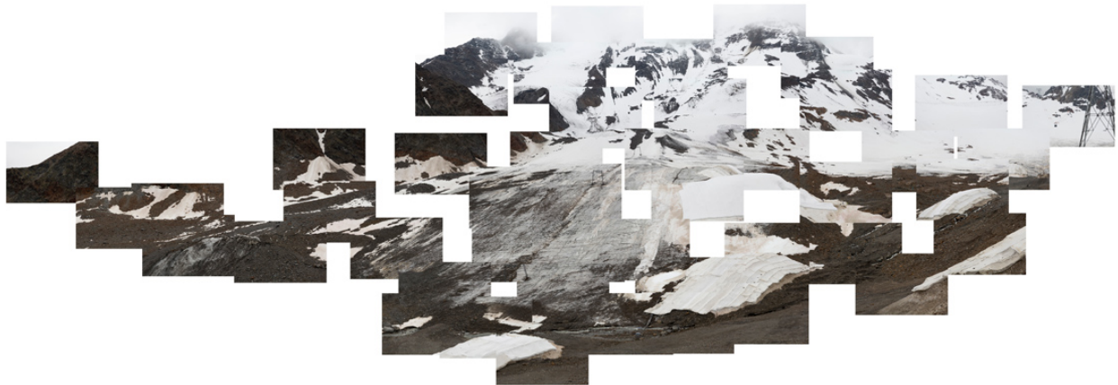
Michael Goldgruber, Mer de Glace, 2020, Wandpanorama-Installation mit 50 Einzelfotos, je 30 x 42 cm, Gesamtgröße ca. 190 x 540 cm © Michael Goldgruber | Bildrecht, Wien 2022